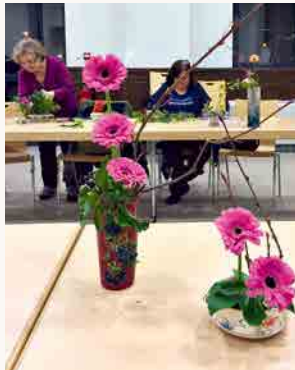
© Hubert Henches ou Catherine Acker ?

Prochaines soirées: 22 mai: composition florale. 12 Juin: thème à définir.