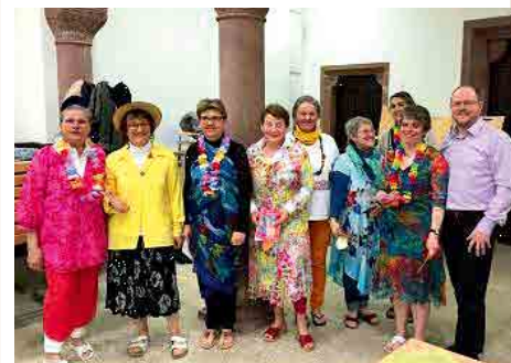
Équipe de préparation.

Les nombreux participants ont exprimé leur joie et leur satisfaction d'avoir pu vivre cette Journée Mondiale de la Prière à Haguenau. Ne ratez pas l'édition 2016.