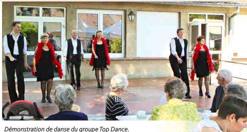
Démonstration de danse du groupe Top Dance.

Un cadre accueillant, un repas partagé, des moments conviviaux, de la bonne musique, il ne manquera plus que vous pour parfaire cette journée ! Renseignements et inscriptions au secrétariat de la paroisse (ouvert du lundi au vendredi de 8h à 9h45 sauf le mercredi et le samedi de 9h15 à 11h).