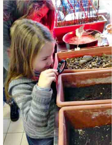
Ça pousse, ou ça pousse pas ?